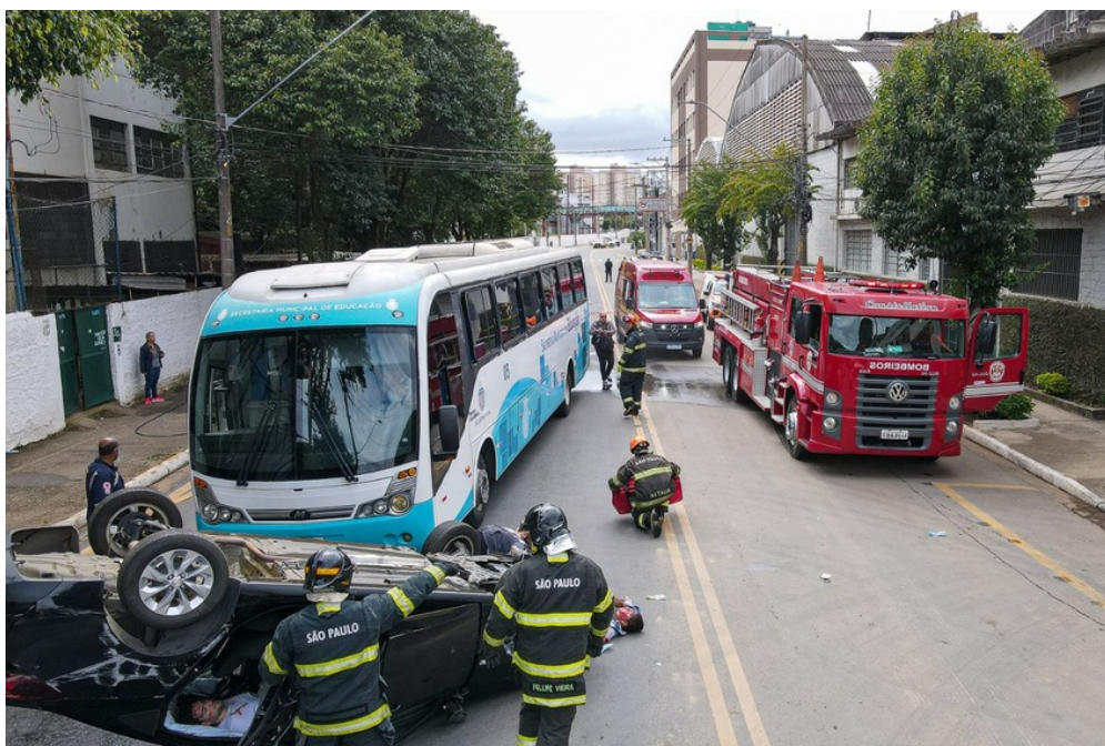
São Caetano envolve mais de 150 pessoas em Simulado de Atendimento a Múltiplas Vidas.

Prefeitura organizou um fim de semana com diversas ações, incluindo palestras e treinamento prático