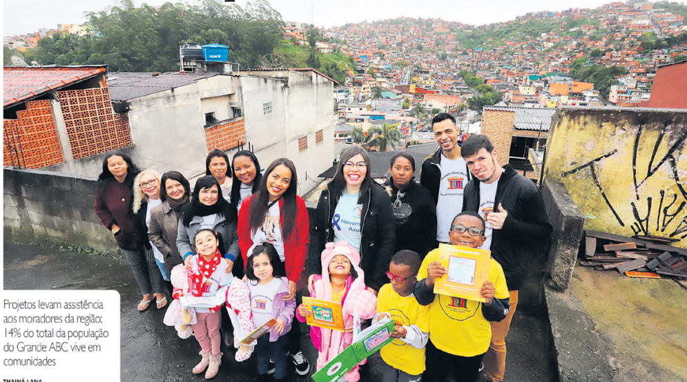
Projetos levam assistência aos moradores da região; 14% do total da população do Grande ABC vive em comunidades