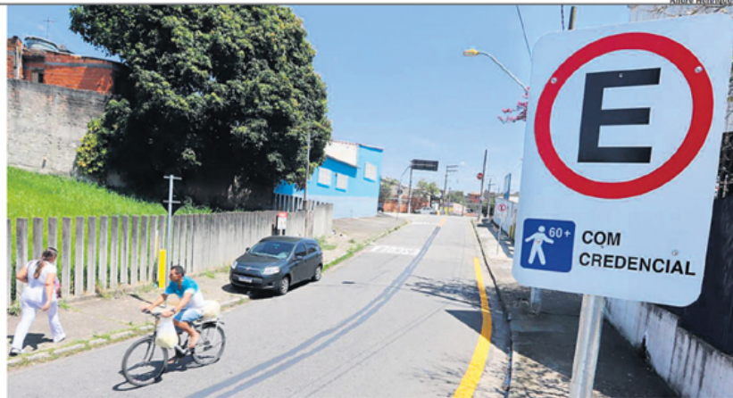
MUDANÇA. Perto de creche na Vila Sacadura Cabral, em Santo André, já é possível ver a nova sinalização.