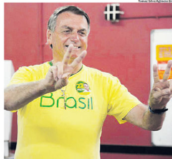
SILÊNCIO. Depois de resultado, Bolsonaro não deu declarações

(Tribunal Regional Federal da 4ª Região) e pelo STJ (Superior Tribunal de Justiça). No STF (Supremo Tribunal Federal), no entanto, os ministros consideraram que a Justiça Federal de Curitiba não poderia julgar o caso, derrubou as condenações e enviou os processos para Brasília, onde foram arquivados por prescrição. Sem condenações, Lula voltou ao radar político para disputar a Presidência da República. Esta foi a quinta disputa do petista. Desde a redemocratização, Lula é o primeiro a ser eleito três vezes. O presidente eleito assumirá a Presidência aos 77 anos, o mais velho da história a ocupar o principal cargo da República.