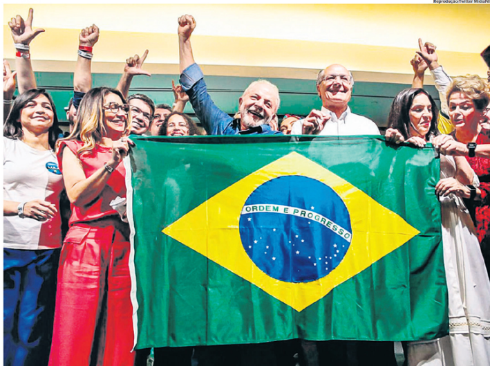
UNIÃO. Lula ao lado da futura primeira-dama, Rosângela da Silva, e do vice, Geraldo Alckmin, depois de discurso de vitória ontem, em SP

Na década seguinte, Lula foi eleito presidente do Sindicato dos Metalúrgicos – cargo que ocupou duas vezes. No final da década de 1970 e começo dos anos 1980, Lula foi preso. Isso porque, as greves realizadas por trabalhadores do Grande ABC foram consideradas irregulares. Naquele momento,