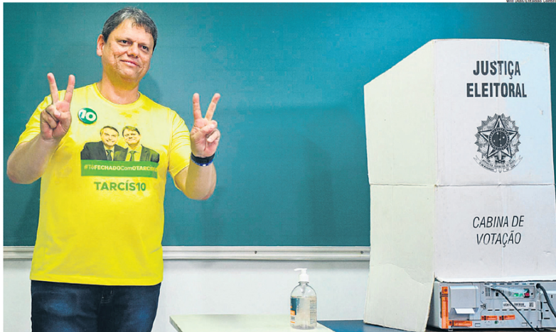
CONCILIADOR. Vitorioso nas urnas, Tarcísio de Freitas afirma que será fundamental para São Paulo manter o alinhamento com a União

Tarcísio destacou ainda a retomada de obras, geração de emprego e políticas de transfe-