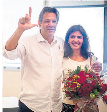
NA REGIÃO. Fernando Haddad foi o mais votado no Grande ABC

Durante a campanha, quando esteve na região, ele mencionou a possibilidade de incluir um nome da região em seu secretariado. "O Grande ABC precisa de um representante de verdade. É uma região muito importante para o nosso Estado e o nosso País. Nós vamos estudar os melhores nomes e, claro, ter alguém da região seria ótimo". (com Estádio Conteúdo)