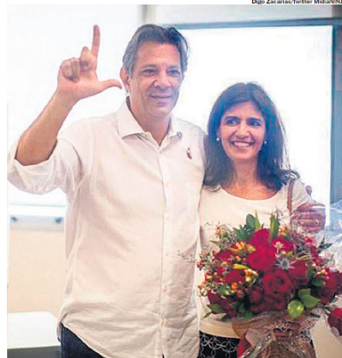
NA REGIÃO. Fernando Haddad foi o mais votado no Grande ABC

Durante a campanha, quando esteve na região, ele mencionou a possibilidade de incluir um nome da região em seu secretariado. "O Grande ABC precisa de um representante de verdade. É uma região muito importante para o nosso Estado e o nosso País. Nós vamos estudar os melhores nomes e, claro, ter alguém da região seria ótimo". (com Estadão Conteúdo)