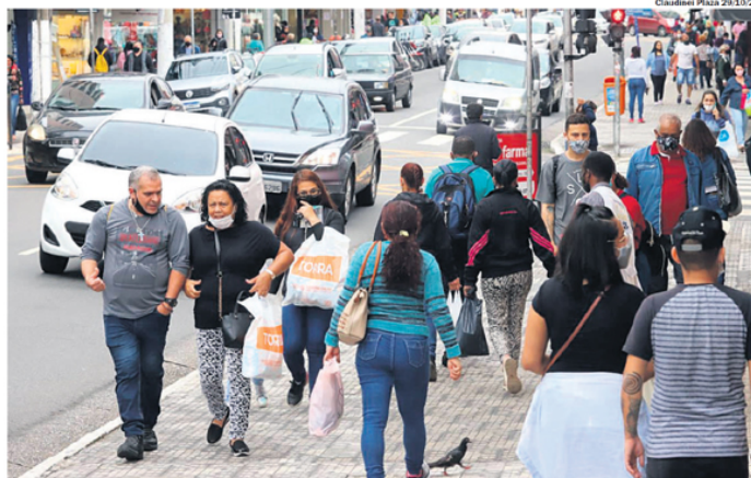
INSEGURANÇA. Ocorrências de crimes contra o patrimônio têm maiores registros nas regiões centrais

Para tentar diminuir os indicadores, a SSP reforçou que nos primeiros oito meses do ano foram detidas 18.221 pessoas, recuperados 7.067 veículos e apreendidas 1.060 armas na Região Metropolitana. “O policiamento em todo o Estado de São Paulo, inclusive no Grande ABC, tem sido intensificado com ações no combate aos crimes patrimoniais por meio da Operação Sufoco, que já deteve mais de 19,5 mil pessoas.”