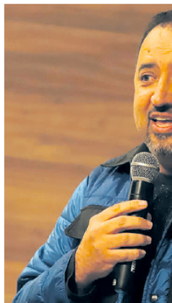
META. Gestão de Marcelo Oliveira

Para negociar a dívida com a Prefeitura, o interessado deverá comparecer ao prédio do Paço, na Central de Atendimento, das 8h às 17h. Os documentos necessários para realizar o acordo, no caso de pessoa física, são RG, CPF e comprovante de residência emitido em até, no máximo, seis meses. É necessário levar originais e cópias.