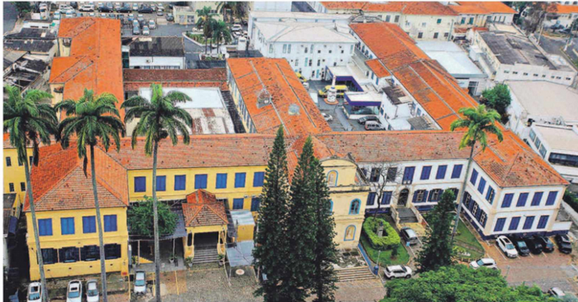
Embora não entre na conta do relatório da Seade, um investimento anunciado foi o da Unidade de Alta Complexidade em Oncologia (Unacon) na Santa Casa de Campinas

O acordo Shell/Braf rendeu um aporte de R$ 48 milhões entre 2019 até o mês passado no Centro Infantil Boldrini, sendo que o dinheiro estava previsto para a implantação do Instituto de En-