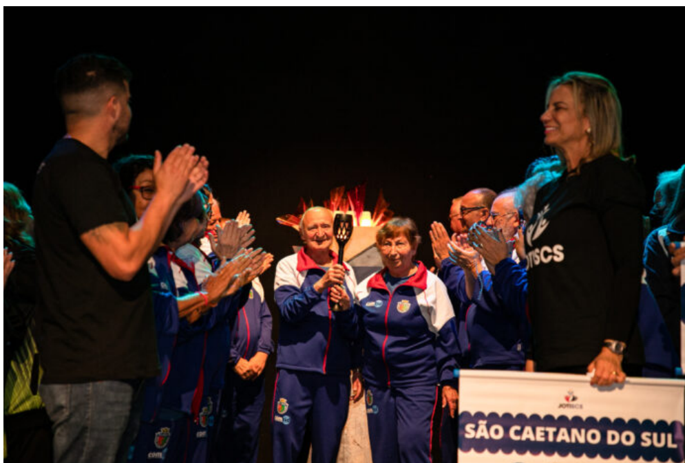
Abertura JOTISCS