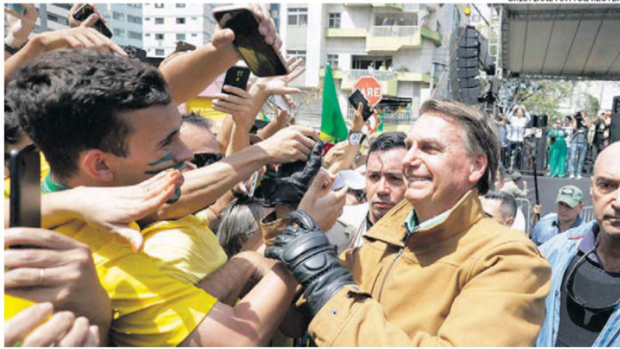
Bolsonaro faz campanha em Divinópolis (MG); presidente e aliados contestam resultado de pesquisas

CONVOCAÇÃO. Grupos de WhatsApp ligados ao deputado estadual Douglas Garcia (PL-SP) e ao deputado federal pelo Rio Carlos Jordy, vice-líder do PL na Câmara, também