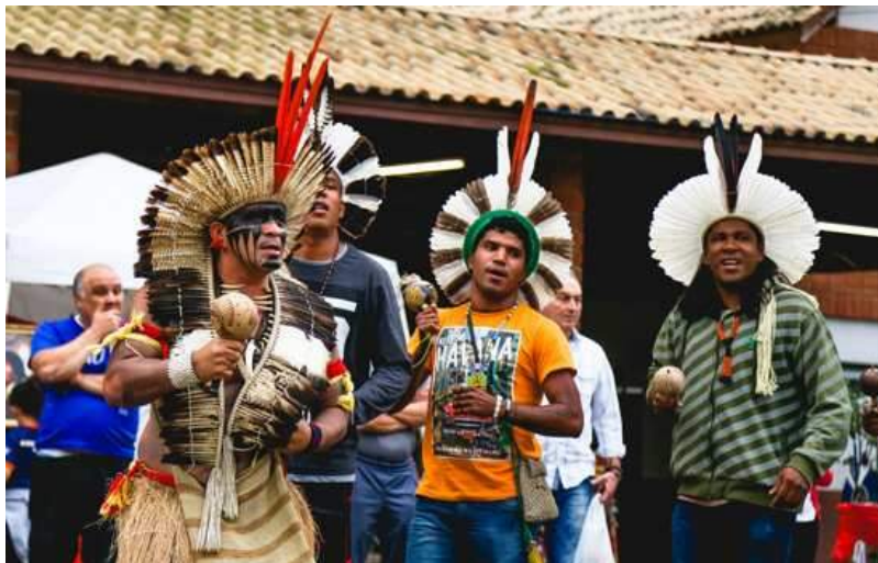
Feira de Cultura Indígena no parque Chico Mendes (2018)

Evento será nesta sexta-feira(16/9) na Estação Cultura; e sábado (17/09) e domingo (18/09) no Espaço Verde Chico Mendes).