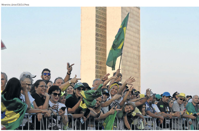
Apoiadores de Bolsonaro se aglomeraram em frente ao Itamaraty, onde o presidente participou de evento. Esplanada está fechada aos veículos

Sem o tradicional desfile militar na Avenida Presidente Vargas, no centro, os militares prepararam oito horas de apresentações. A primeira das salvas de canhão será às 8h e se repetirá de hora em hora. Pela manhã, bandos do Exército se exibirão em bairros do Rio. A parada naval, com navios da Marinha do Brasil e de países amigos, partirá do Recreio dos Bandeirantes, às 9h, em direção à Baía de Guanabara. (Colaborou Vinícius Dorla)