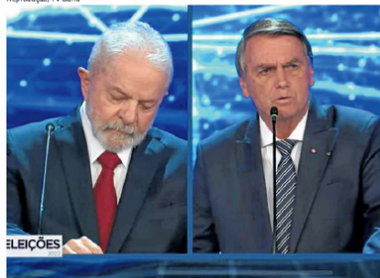
Lula foi cobrado sobre corrupção e Bolsonaro hostilizou uma jornalista