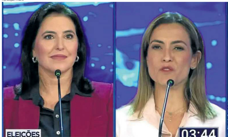
As duas senadoras se sobressairam pelas perguntas incisivas e respostas fortes, mas elegantes, que tiveram Bolsonaro e Lula como alvos