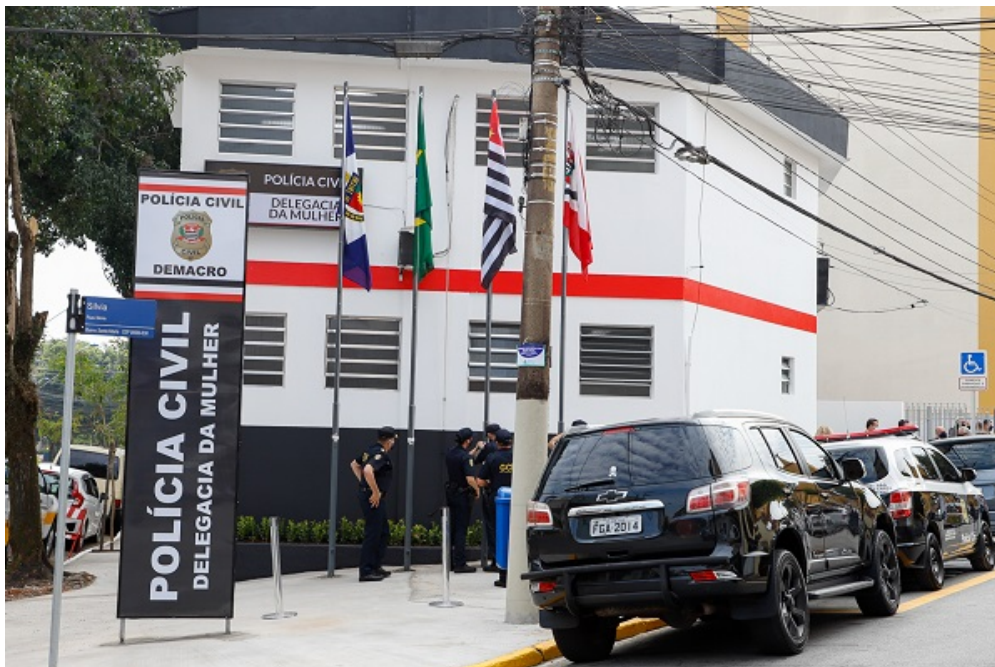
Fachada da Delegacia da Mulher de São Caetano

Entre as principais diretrizes do programa estão a instrumentalização e capacitação da GCM e dos demais agentes públicos envolvidos, visando o atendimento humanizado e qualificado no campo de atuação da lei; parceria com as polícias do Estado; prevenção e combate às violências física, psicológica, sexual, moral e patrimonial contra mulheres, entre outras.