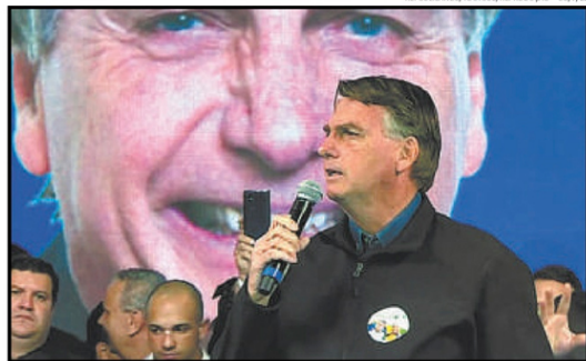
REPUBLICANOS/POURBIE/REPRODUÇÃO - 30/1/22