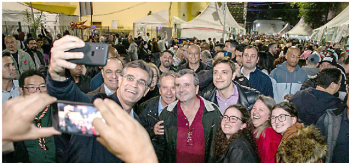
Governador Rodrigo Garcia saboreou as iguarias da Festa Italiana, no último sábado, recebeu o carinho da população e aproveitou para fazer fotos e selfies