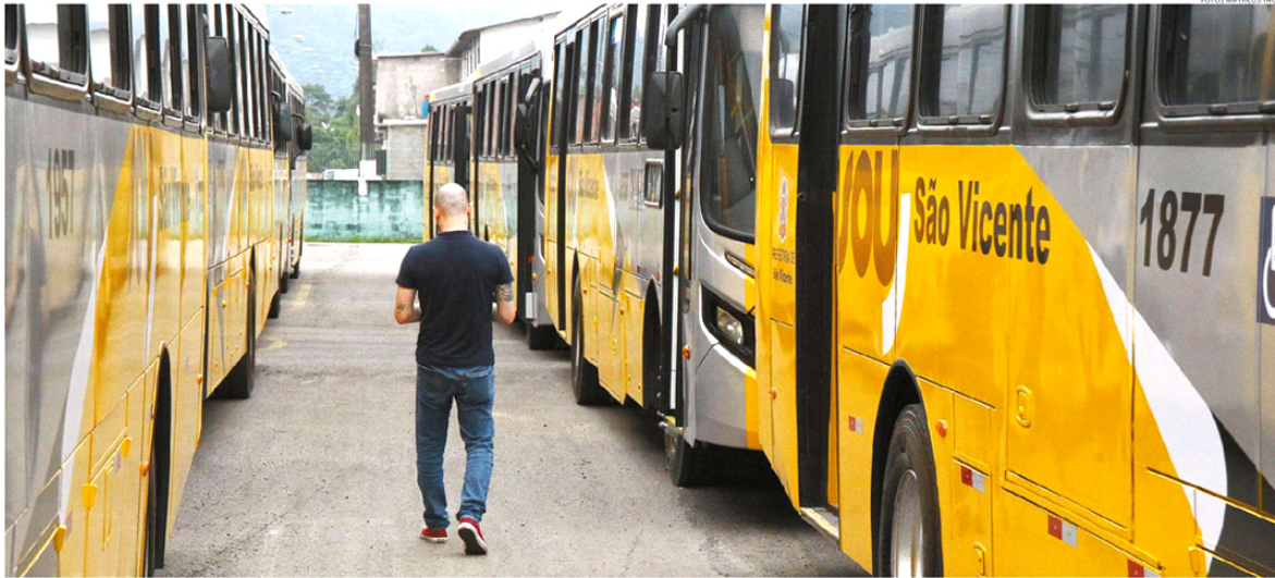
Da frota de 75 veículos, 43 são micro-ônibus e há 32 ônibus básicos, que começaram a chegar na quarta-feira passada. Os veículos podem ter até oito anos de fabricação, com ar-condicionado e acessibilidade