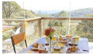
Queridinho das redes sociais, o Frutta e Crema surgiu como sorveteria e só há cinco anos inaugurou o restaurante