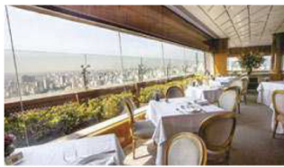
O Terraço Itália está a 165 metros de altura e tem vista privilegiada de todo o centro da cidade de São Paulo