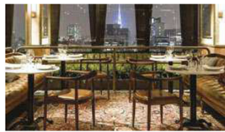
Localizado no 23º andar do hotel Tivoli Mofarrej, o Seen São Paulo apresenta espaço aberto que se mescla com a vista urbana