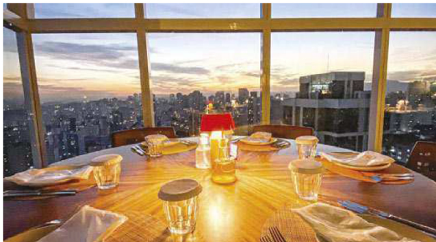
Próximo ao Campo de Marte, na zona norte, e com uma visão ampla da capital paulista, o Lassù abriu suas portas em 2019

O Seen São Paulo funciona de segunda a sábado, das 19h às 01h e fica na Alameda