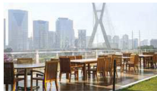
Com vista para um dos cartões postais da cidade de São Paulo, a Ponte Estalada, o Green foi inaugurado em abril deste ano