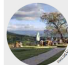
Na Vinicola Terrassos é possível conhecer os vinhedos e os jardins

Inaugurada em 2016, o bistrô trabalha com o conceito de cozinha slow food, que preza pelo preparo único de cada prato, respeitando o tempo de cada um dos ingredientes. O menu é fechado e conta com couvert, prato principal e sobremesa, a partir de R$ 685, sem bebida. O Pontremoli fica na rua das Hortências, 605, Alto Boa Vista, Campos do Jordão. As reservas devem ser feitas de terça a domingo, das 13h às 21h, no telefone (12) 93794-1213