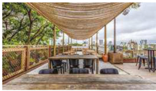
A Vista do Jacaré Grill contempla a região arborizada da Vila Madalena; pratos da casa na zona oeste saem a partir de R$ 36