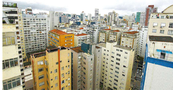
Entre os requisitos para solicitar o desconto estão ter renda familiar de até seis mínimos e um só imóvel