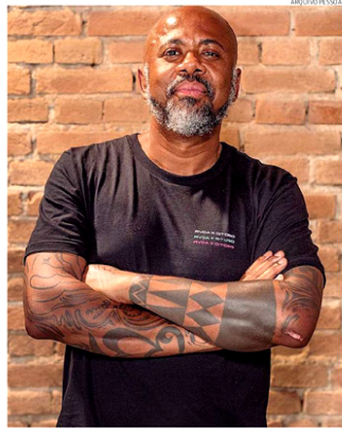
Para o cientista político, novos eleitores não vivem em uma bolha

A maioria dos consultados (62%) informou que tem como principal valor social o combate à fome e à pobreza. Na sequência, apareceram os seguintes itens: combate à corrupção (35%); um país com economia forte e que gere empregos (33%); combate ao preconceito (33%);