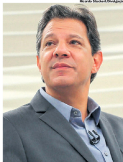
HADDAD. Aparece com 36,6% das intenções