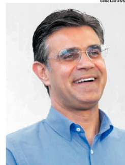
RODRIGO. Governador pulou de 2,9% para 12,1%

Badra ainda aparece o nome do ex-prefeito de São José dos Campos Felício Hamuth, com 2,3%, que trocou o PSDB pelo PSD para ser o candidato do partido, mas após costura de Gilberto Kassab (PSD) foi indicado como vice do ex-ministro na eleição. A questão é para onde irá migrar esse percentual do ex-prefeito, se para Rodrigo ou Tarcísio.