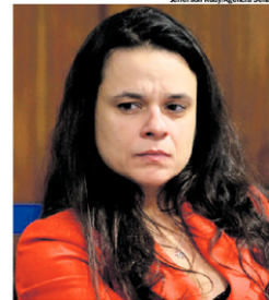
JANAINA. Em 2018, recebeu 2 milhões de votos

tenções de votos. Após ganhar notoriedade no processo de impeachment de Dilma Rousseff (PT), na eleição de 2018 ela obteve mais de 2 milhões de votos para a Assembleia Legislativa, que a colocou na história como a parlamentar com maior votação do Brasil.