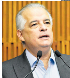
FRANÇA. Ex-governador está na liderança

Quem também tenta a benção do presidente Jair Bolsonaro (PL) como principal apoiador é a deputada estadual Janaina Paschoal (PR-TB), que aparece em terceiro lugar, com 12,6% das in-