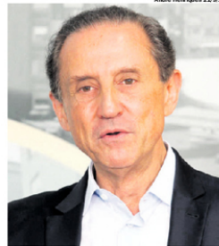
SKAF. Foi três vezes candidato a governador