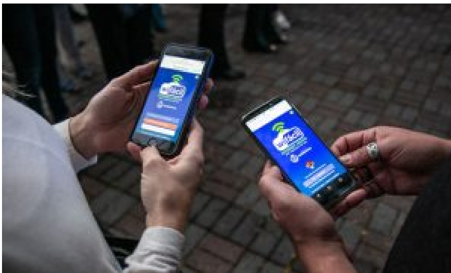
Lançamento WiFacil – Praça Virgílio Leandrini

Mas a inclusão digital foi além dos muros das escolas e chegou também às praças da cidade. Visando a levar ainda mais conhecimento à população, garantindo “todo mundo conectado”, em 2018 a administração lançou o programa Wi-Fácil, passando a oferecer internet gratuita nos parques e praças. Para acessar a internet nessas áreas públicas, basta se conectar à rede Wi-Fácil São Caetano do Sul e