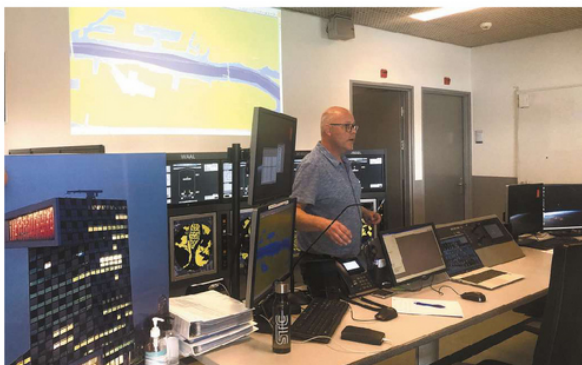
Integrantes da comitiva Porto & Mar tiveram aula na STC sobre Portos Inteligentes na manhã de ontem

do “fantástica”. “Estamos em contato com o que há de mais moderno em termos de gestão portuária, na região mais importante da Europa. São lições que vamos levar para o dia a dia, fundamentais para o nosso trabalho. Vou levar para a Antaq tudo isso para melhorar a eficiência dos nossos portos”.