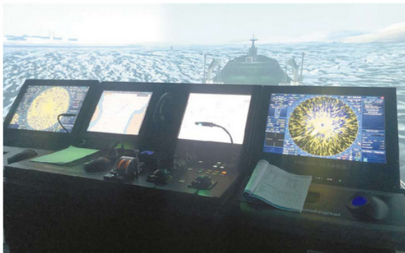
Centro de Simuladores projeta navio em alto-mar e ajuda a capacitar pessoas para o dia a dia do setor