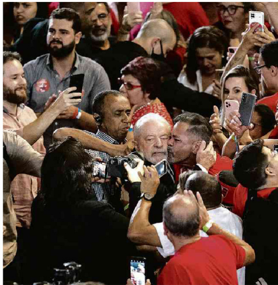
Ex-presidente Lula durante evento em Juiz de Fora (MG)