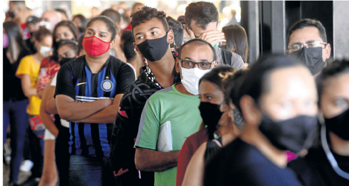
Brasilienses lotam pontos de testagem para infecção pelo novo coronavírus, como a Rodoviária do Plano Piloto. Taxa de transmissão está em 1,47