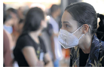
Vitória Rodrigues critica a demora para a testagem na Rodoviária