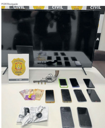
Ações da polícia do DF tentam inibir furtos de aparelhos