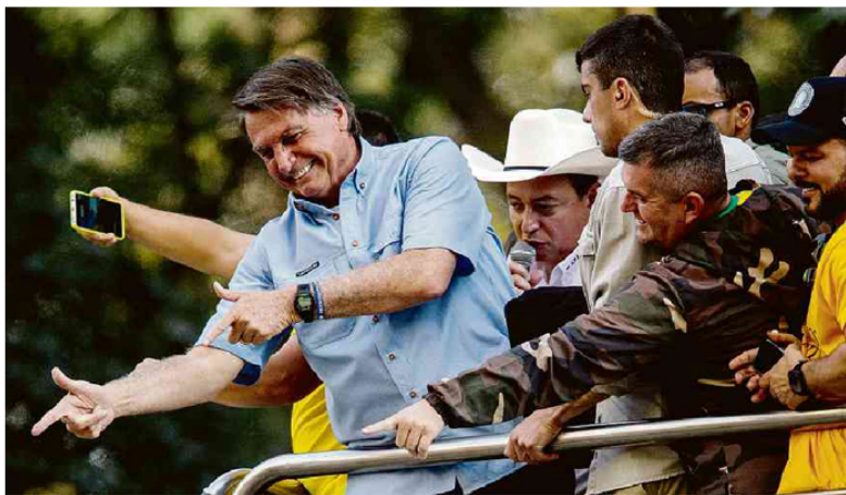
O presidente Jair Bolsonaro participa de manifestação na avenida Paulista, em São Paulo