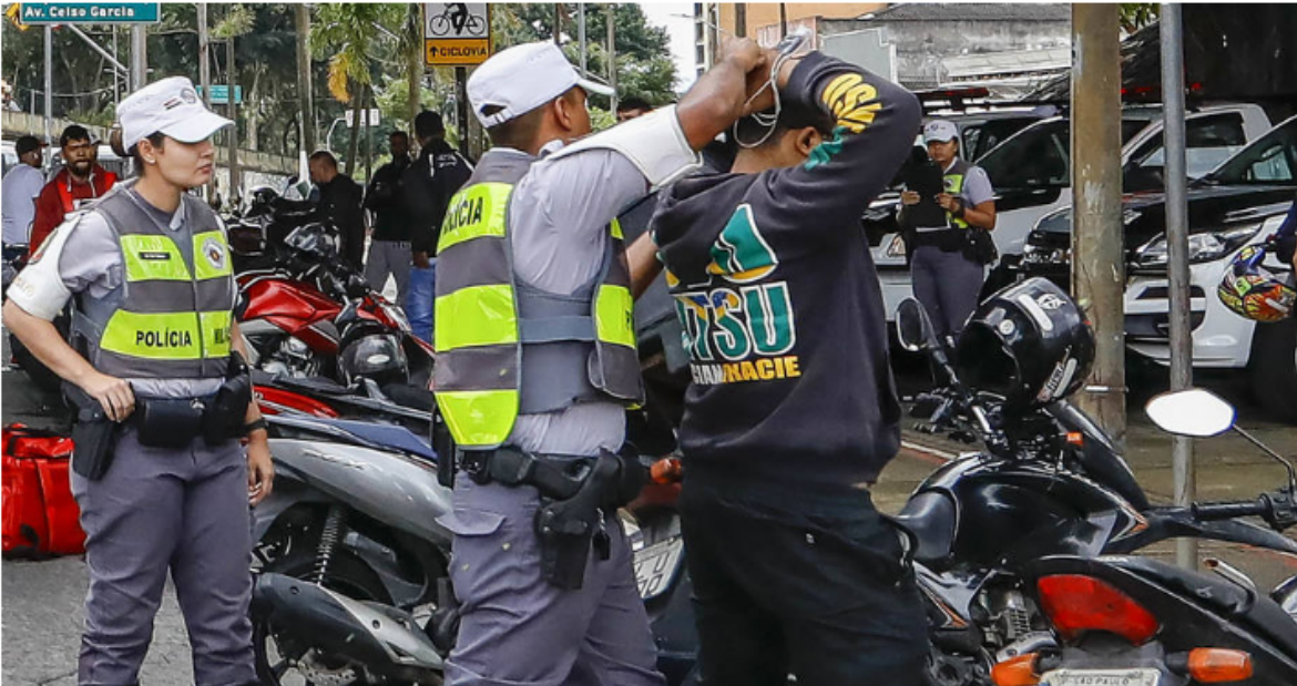
Policiais realizam revista durante blitz na região central de São Paulo 04/05/2022

A Secretaria da Segurança Pública (SSP) afirma que está atuando continuamente no combate à criminalidade no Estado, que apresentou queda de 4% nos roubos no primeiro trimestre em comparação com o mesmo período de 2019 (período pré-pandemia).