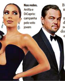
Nas redes, Anitta e DiCaprio: campanha pelo voto jovem

com Leonardo DiCaprio sobre eleições no Brasil durante o baile Met Gala. “Ontem eu passei horassss com o @LeoDiCaprio falando sobre a importância dos jovens tirarem seu título de eleitor. Está na reta final. Vocês sabiam que ele sabe mais sobre a importância da nossa floresta Amazônica do que o presidente do