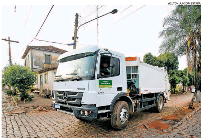
Caminhão de lixo em Pontalina (GO); cidades promovem eventos para celebrar chegada de veículo

A diferença dos preços de compra de modelos idênticos, em alguns casos, chegou a 30%. Em outubro passado, por exemplo, o governo adquiriu um modelo de caminhão por R$ 391 mil. Menos de um mês depois, aceitou pagar R$ 505 mil pelo mesmo veículo. Há casos também em que o governo recebeu veículos menores do que o comprado sem reaver a diferença de preço. Um município de 8 mil habitantes ganhou três caminhões compactadores num período de um ano e três meses, enquanto ci-