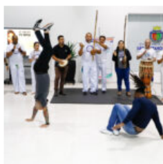
Dialogos Ng Oma