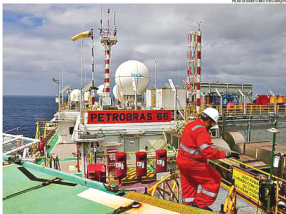
Risco no horizonte. Plataforma da Petrobras: executivos da estatal temem guinada do governo para controle de preços

O novo presidente da Petrobras era considerado "ho-