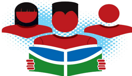
PERFIL DOS GRADUANDOS POR RAÇA/COR AUTODECLARADA