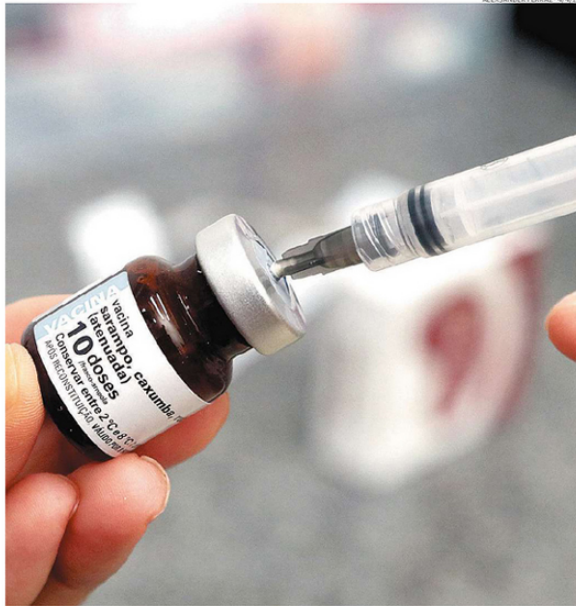
Cidade tem três casos suspeitos de sarampo. Vacina ajuda a evitar doença e a prevenir complicações

que não estuda, neste momento, ampliar o horário de atendimento das policlínicas, porque não há filas.