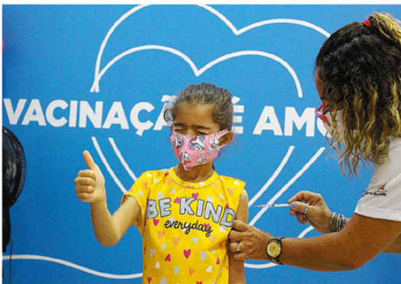
Coragem, olhos fechados e dose garantida: esta menina foi imunizada no Brisamar Shopping, em São...

6 meses a 4 anos e 11 meses de idade, além do público-alvo inicial (idosos e traba-