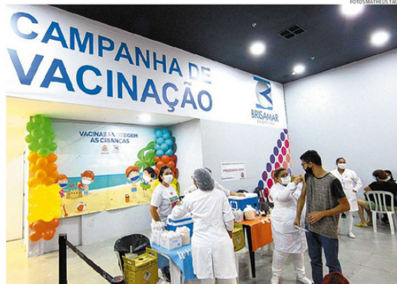
... Vicente, um dos municípios que anteciparam a aplicação de doses dos 6 meses aos 4 anos e 11 meses

Veículo: Impresso -> Jornal -> Jornal A Tribuna - Santos/SP