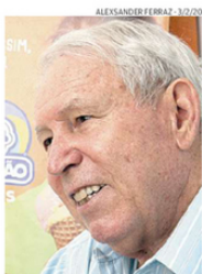
Antoneli cita saque extra do FGTS