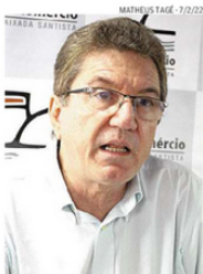
Isso ameniza a inflação, diz Assaf

Aqueles que começaram a receber o benefício depois de janeiro deste ano terão o valor do 13º salário calcula-