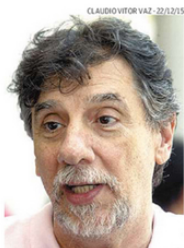
Obeiði indica comprar na Cidade