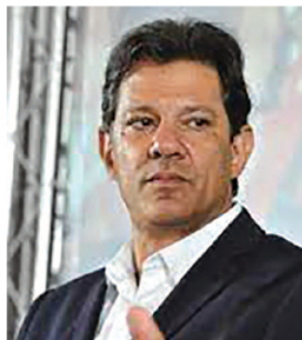
Cezar (PDT), com 1%.

Em terceiro lugar aparece o ex-ministro da Infraestrutura, Tarcísio de Freitas (Republicanos), com 13%, e o atual governador paulista, Rodrigo Garcia (PSDB), com 5%. Na sequência, nesse cenário, aparecem Felício Ramuth (PSD), com 2%, Vinicius Poit (Novo), Abraham Weintraub (PMB), Altino Junior (PSTU) e Elvis