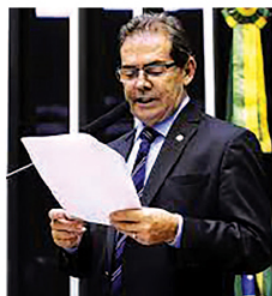
como a melhor opção em se tratando de defesa dos trabalhadores e da reorganização econômica e política do país.

Após um breve retrospecto referente às ações que tem realizado no Congresso Nacional, o deputado defendeu o voto no ex-presidente Lula