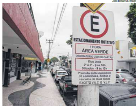
Estacionamento rotativo não tem o respeito de todos

Veículo: Impreso -> Jornal -> Jornal da Cidade - Bauru/SP