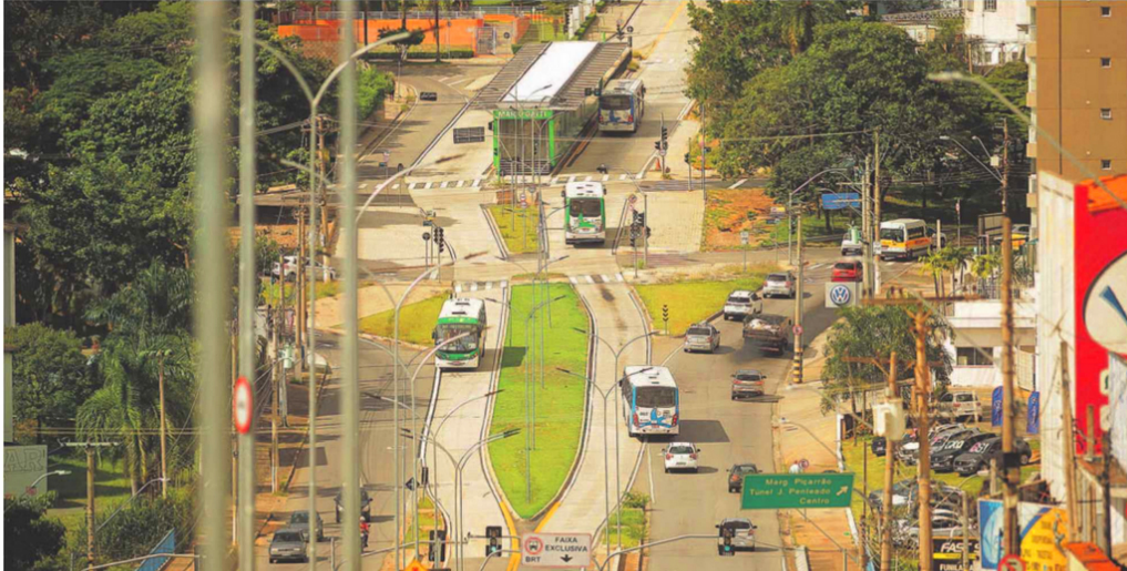
A Avenida das Amoreiras, onde estão localizados corredores do sistema BRT, é um dos locais onde a empresa vencedora da licitação em andamento na Emdec instalará parte dos novos radares em Campinas