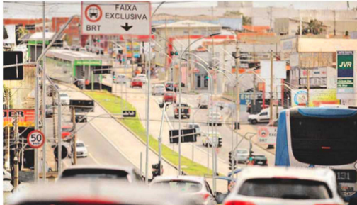
Novos radares vão ter como foco os motoristas que invadem faixas exclusivas para o transporte coletivo