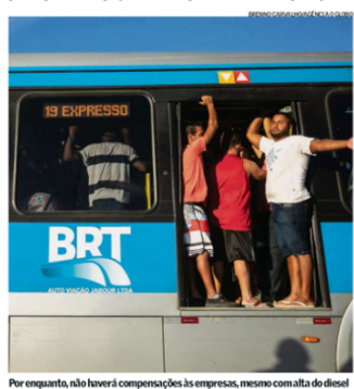
Por enquanto, não haverá compensações às empresas, mesmo com alta do diesel