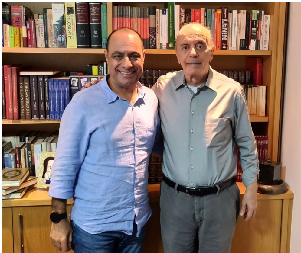
Auricchio com Serra.