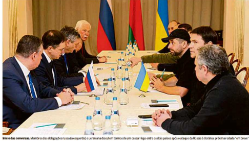
Início das negociações. Membros das delegações russa (à esquerda) e ucraniana discutem termos de um cessar-fogo entre os dois países após o ataque da Rússia à Ucrânia na primeira rodada de negociações.