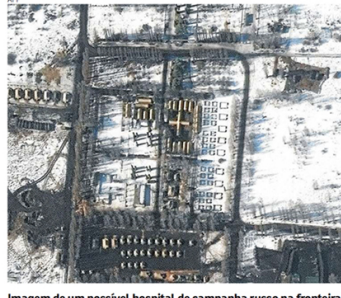
Imagem de um possível hospital de campanha russo na fronteira

Jean-Yves Le Drian, os ministros das Relações Exteriores do grupo "concordaram, por unanimidade, com um pacote inicial" de retaliações. As medidas, na avaliação do chefe da diplomacia da UE, Josep Borrell, "prejudicariam muito a Rússia". Uma delas, especificou Borrell, será o bloqueio de ativos e a proibição de vistos para 351 deputados russos. Além disso, o chanceler alemão, Olaf Scholz, anunciou que suspendeu a autorização do controverso gasoduto Nord Stream 2, que liga a Rússia à Alemanha, evitando passar pela Ucrânia. Em Londres, o primeiro-ministro