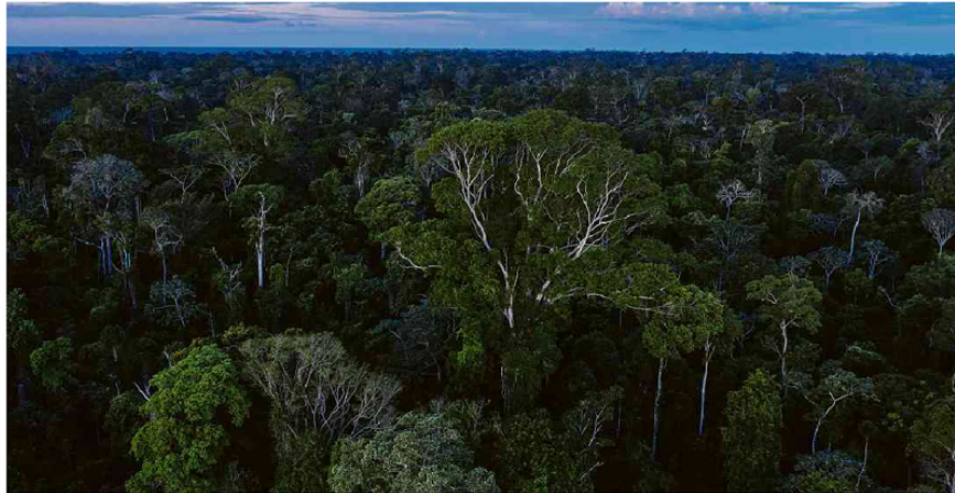
Área preservada da Amazônia próxima a Uruará, no Pará; ANM autorizou exploração de nióbio no município. Lailo de Almeida - 18.jul.20/Folhapress