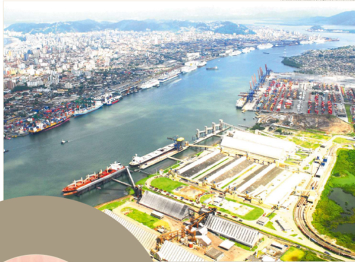
O túnel entre Santos e Guarujá é um dos projetos mais aguardados no Porto de Santos e pode ser um divisor de águas no setor logístico regional