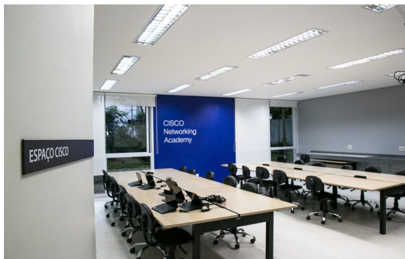
Espaço Cisco na Escola de Informática.

Há opções de cursos para todas as faixas etárias (a partir dos 6 anos de idade) e níveis de conhecimento. Os iniciantes, por exemplo, podem fazer o curso À procura de um emprego com o Google . Quem já tem alguma familiaridade com a informática poderá fazer aprender a manejar o programa de desenho Corel Draw ou a plataforma Arduíno , que permite executar projetos de automação, apenas para citar alguns exemplos. Para as crianças, há cursos de programação com o software Scratch e Scratch Jr . Há, também, Eletrônica para Robótica , Edição de Imagem e Vídeo , Design , Marketing Digital etc. São 25 diferentes cursos, ministrados em dois ou três encontros semanais.