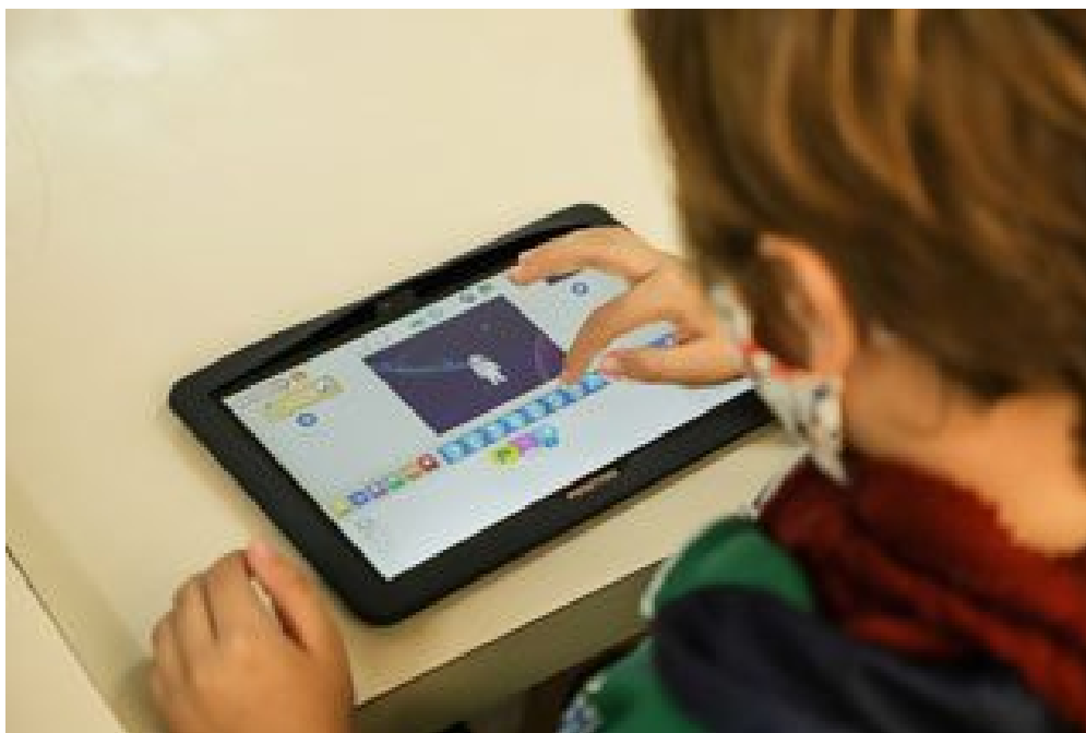
Aluno em Aula de Scratch.

A partir desta quinta-feira (13.01) estarão abertas as inscrições para os cursos da EMNOVA (Escola Municipal de Novas Tecnologias), de São Caetano.