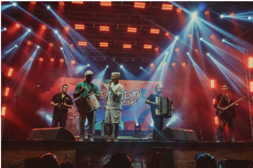
Circuladô de Fulô

A 15ª Entoada Nordestina promoverá também espetáculos de dança, oficinas de arte e atividades para o público infantil, além de uma diversificada oferta de delícias da culinária regional. Em breve será divulgada a programação completa, nos canais oficiais da Prefeitura de São Caetano e Secretaria de Cultura.