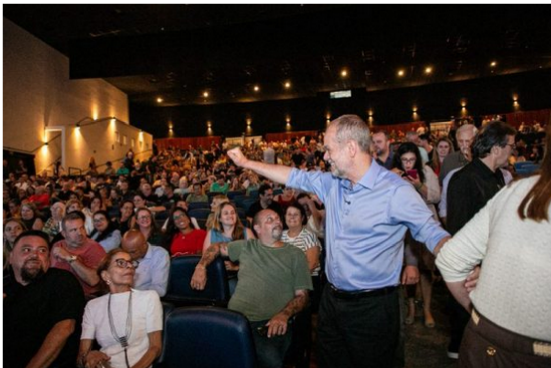
Tite presta contas.

O prefeito, Tite Campanella, apresentou na noite desta quinta-feira (27.03), em primeiro lugar, a prestação de contas do governo.