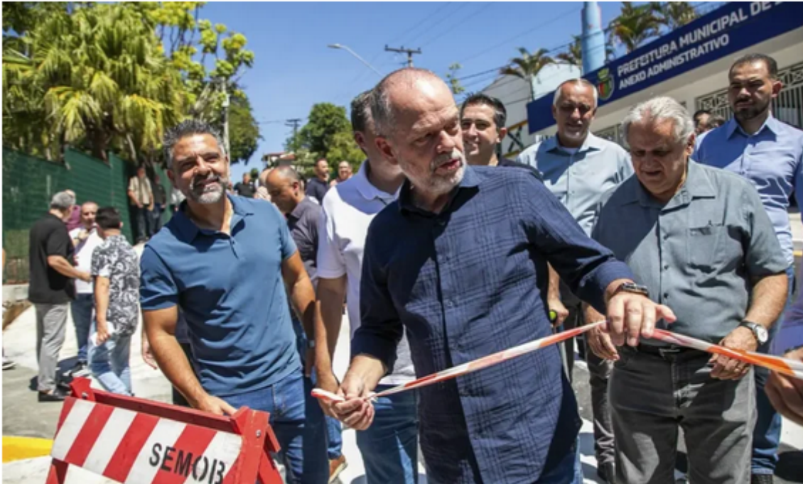
Pedido atendido São Caetano reabre trecho da Rua Eduardo Prado e cria novas vagas de estacionamento

“Desde o início da nossa gestão temos procurado andar muito pela cidade e acima de tudo ouvir aquilo o que pensa o morador de São Caetano. A reabertura deste trecho foi uma demanda muito requisitada por moradores e frequentadores do Chico Mendes”, ressaltou o chefe do Executivo.